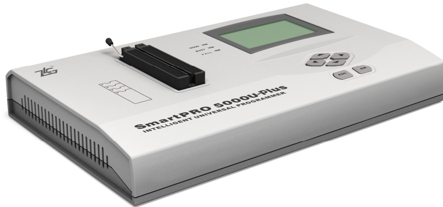
图 1-1 产品外观

当前广州致远电子股份有限公司 SmartPRO 系列编程器中的 SmartPRO 5000U-PLUS 以及 SmartPRO T9000-PLUS 支持芯片 PCF7952，并可以做类似芯片的升级工作。本文将从烧写性能、操作方式以及成功案例来说明 SmartPRO 系列编程器烧写 PCF7952 的优势。